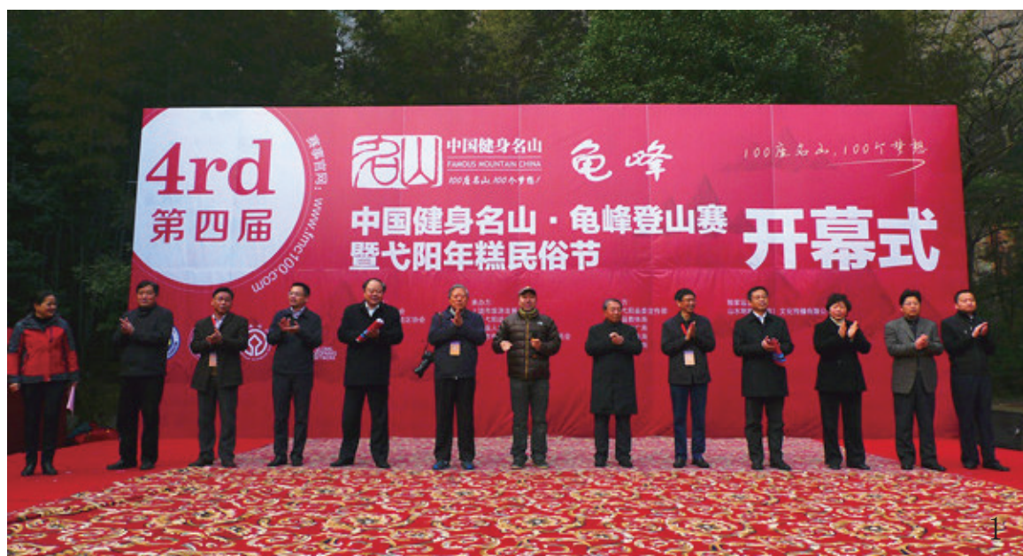
1 “中国健身名山”登山赛龟峰站开幕式现场 2 1300名运动员争先出发