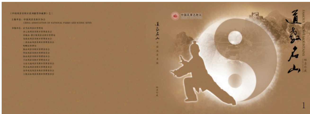
1 邮册封面 2 邮册前言

为搭建道教名山风景名胜区互促互鉴、合作共赢的交流平台，根据2013年10月在江西省三清山召开的风景名胜区道教名山文化发展座谈会上达成的议定事项，联合编辑出版《中国风景名胜·道教名山》邮票珍藏册，邮票珍藏册包括中国风景名胜区-道教名山联盟景区的全套纪念邮票、个性化邮票及精装珍藏册，以展示道教名山自然与文化资源。第一册由14家景区参编，已于2014年7月底出版，共计3000册。