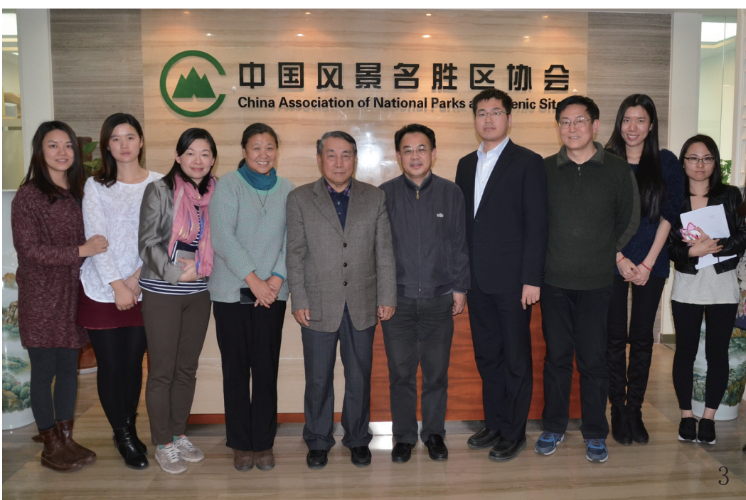
3 住房城乡建设部城建司副司长章林伟（图右五）、城建司世界遗产与风景名胜管理处处长左小平（图左四）与中国风景名胜区协会副会长兼秘书长王凤武（图左五）、副秘书长厉色（图右三）及中国风景名胜区协会工作人员合影