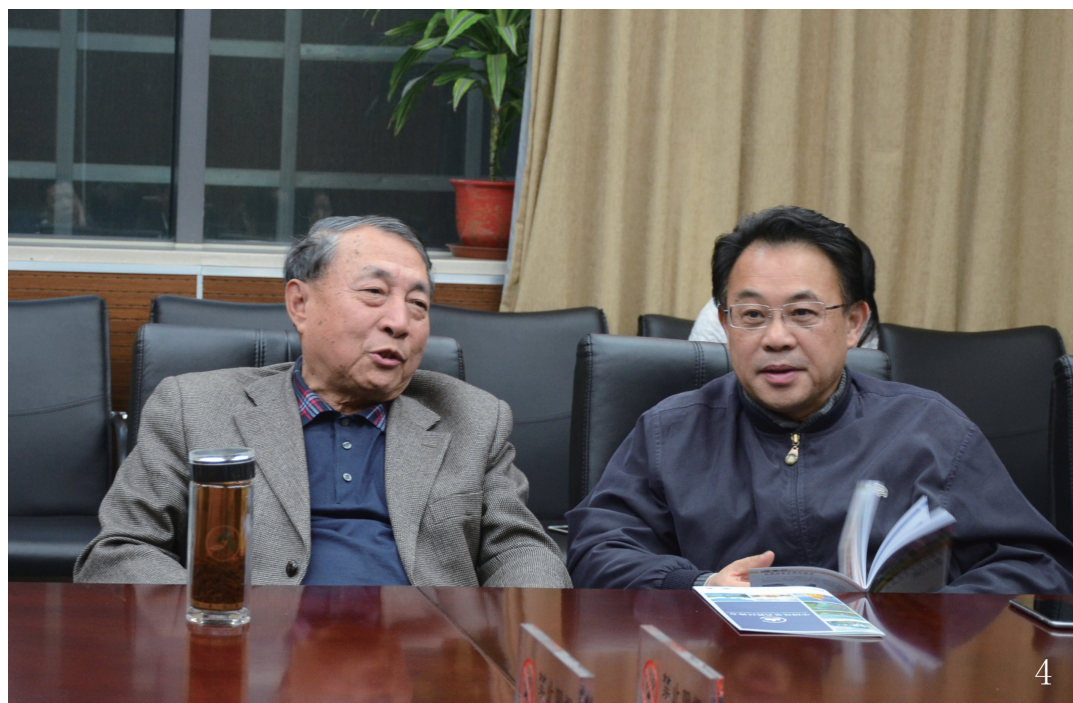
4 住房城乡建设部城建司副司长章林伟（图右）与中国风景名胜区协会副会长兼秘书长王凤武（图左）交流

1月14日下午，住房城乡建设部城建司副司长章林伟、城建司世界遗产与风景名胜管理处处长左小平莅临协会检查、指导工作并座谈。 协会负责人王凤武秘书长表示，协会是连接政府和风景名胜区的桥梁和纽带，协会愿意承担政府分流的职能，为住房城乡建设部提供咨询和技术服务。同时，也提出了目前协会工作面临的主要困难和问题：目前协会面临换届转型期，协会和景区领导的兼职问题也很复杂，处理起来有一定困难。 在听取了协会的工作汇报后，章林伟副司长就目前风景名胜区工作作出重要指示。首先是国家公园的问题。章林伟副司长认为，我国风景名胜区拥有健全的法律制度，掌握了具有国家代表性的最好的资源，形成了保护优先、合理利用的工作理念，与自然保护区封闭式的管理完全不同。因此，风景名胜区最适合作为国家公园的主体，要在这方面多下功夫，不能等闲视之。国家公园涉及到的部门众多，包括环保部、国家林业局等，而住房城乡建设部只有风景处在做这项工作，人单力薄。十八届三中全会明确提出要建立国家公园体制，希望协会占领制高点，把理论灌输给高层决策者；同时要加大社会宣传力度，组织活动，向公众普及国家公园知识，扩大影响力。目前公众对风景名胜区体系下的景区评级标准了解甚少。如何依托协会资源，发挥自身作用，扩大风景名胜区的影响，是值得考虑的问题。 章林伟副司长还指出，风景名胜区的规划问题不容忽视。通过今年的审计发现，全国有较多国家级风景名胜区中的规划审批存在问题。陈部长对此事很重视。在规划审批报送的过程中，责任问题是关键。涉及到国务院、住房城乡建设部、其他部委以及地方政府的责任问题。如何解决这些问题，希望协会帮忙出主意。随着行政体制改革的推进，重大项目的审批已经下放，接下来的问题就是，要不要下放详规？如果详规下放，对总规的要求就要提升，这些都是必须要考虑的问题。协会应充分发挥自身优势，把标准纳入制度，把制度设计好，以标准来支撑制度的实施。 在对协会工作提出意见和建议的同时，章林伟副司长也希望协会充分发挥自身职能，在建立国家公园体制方面多下功夫，在新形势、新常态、新的政府格局下，在行业标准制定、科研课题研究等方面充分发挥作用。通过各种宣传活动，把风景名胜区做大、做强、做响，提高风景名胜区的社会影响力和知名度。