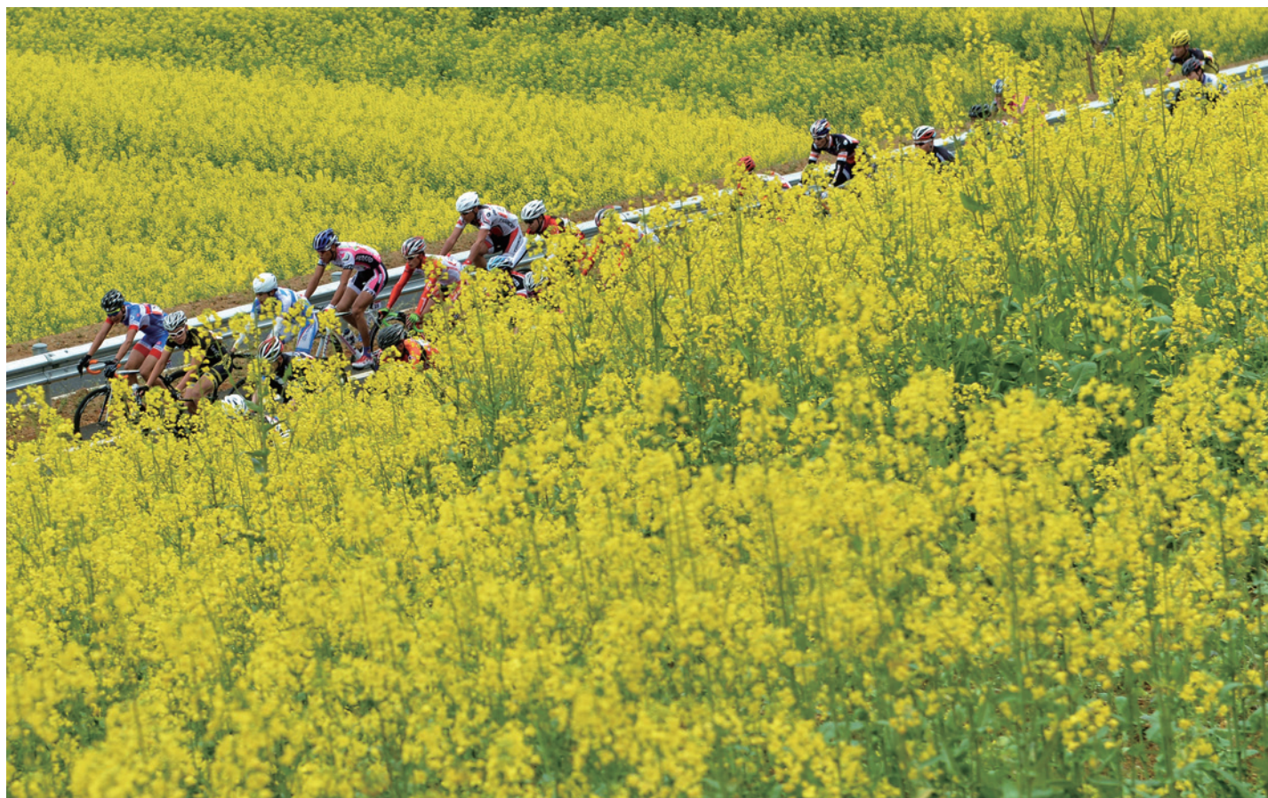
赛道沿线的秀美风光

本站比赛分为男子公开组（公路车型）、女子公开组（山地车型）、男子年龄A组（山地车型）、男子年龄B组（山地车型）和全民健身组5个组别。其中男子公开组将挑战140公里环湖赛道，首次突破联赛100公里，成为千岛湖站的最大看点；全民健身组由一天增加到两天，参赛选手可以在一个多小时的赛程中饱览千岛湖南岸的秀美风光。